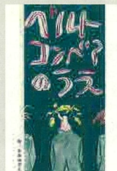
故事漫畫【自由組】 作品名:在傳送帶上 筆名:NARUHANOTO