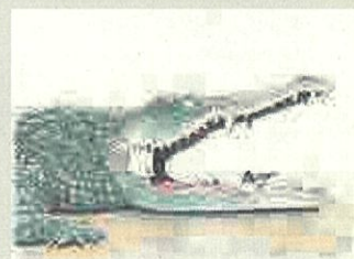
單頁漫畫【自由部門】(約定) 作品名:鱈魚與牙籤鳥的約定 筆名:小林尚武(NAO TAKE)