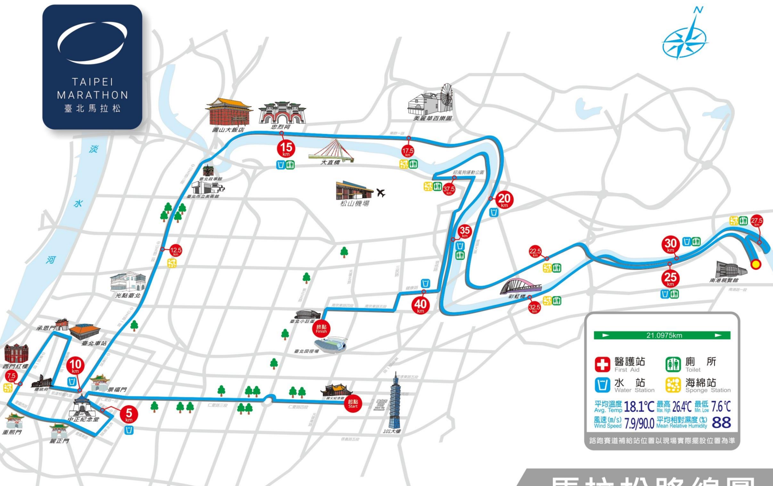
Marathon Route Map 馬拉松路線圖