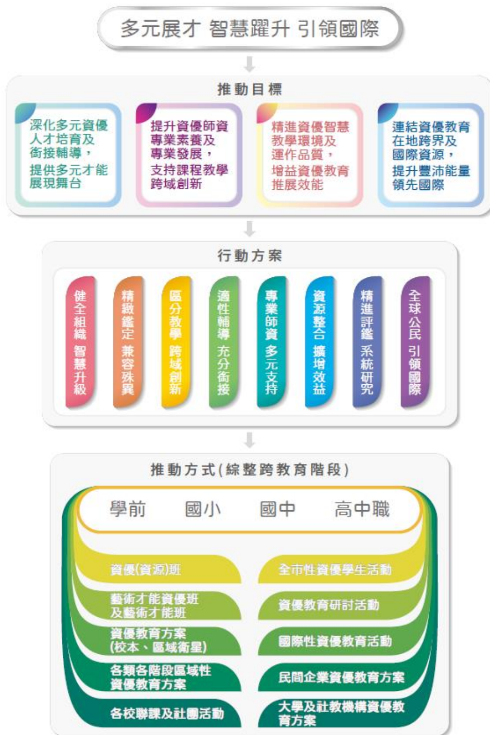
圖 2 臺北市資賦優異教育白皮書—中長程發展計畫 (2021-2026) 推動架構