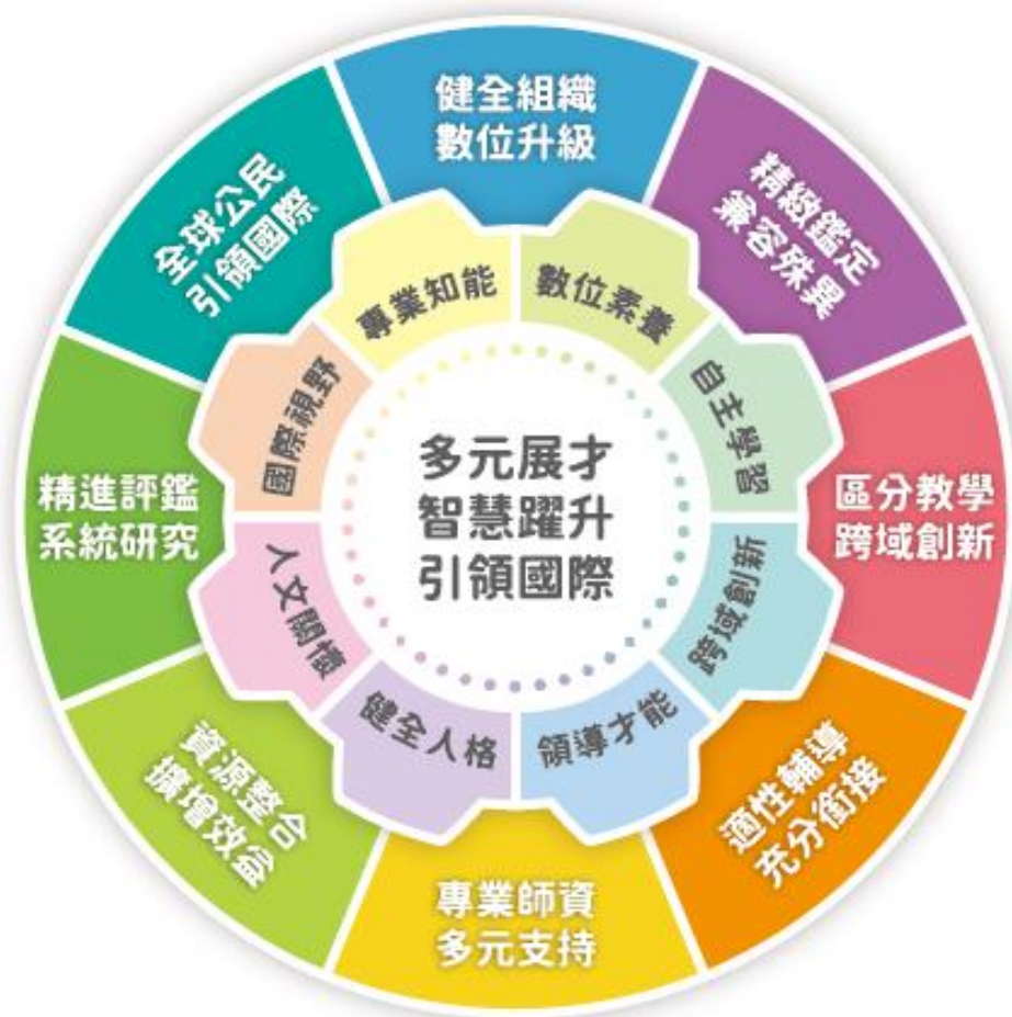
圖 1 臺北市資優教育白皮書—中長程發展計畫 (2021-2026) 推動願景

本市《資優教育教育白皮書—中長程發展計畫》(2021-2026) 以培育兼具「專業知能、數位素養、自主學習、跨域創新、領導才能、健全人格、人文關懷及國際視野」等素養之多元領域未來優質人才為推動核心。期透過各項行動方案及全面性、多元化推動方式，達到本市「多元展才 智慧躍升 引領國際」之願景（如圖 1）。其推動架構，如圖 2。